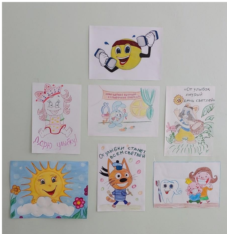
Коллаж «В каждой улыбке-Солнце!!!»